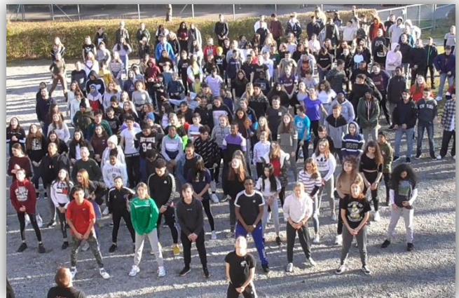
Dance Day in der OSZ Madretsch Biel mit 227 Schülerinnen und Schülern