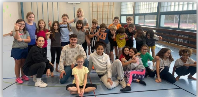
Dance Day in der Primar Gsteighof Burgdorf mit insgesamt 88 Kids