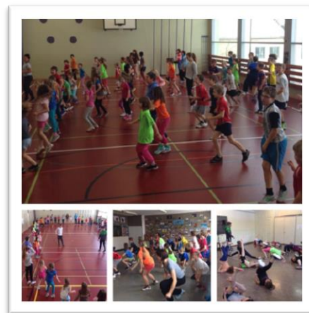
Tanz-Nachmittag in der Primarschule Wyssachen mit über 60 Kids