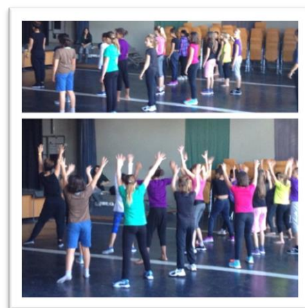
Tanz-Lektion Schule Spiegel