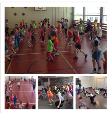
Tanz-Nachmittag in der Primarschule Wyssachen mit über 60 Kids