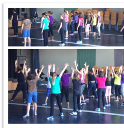
Tanz-Lektion Schule Spiegel